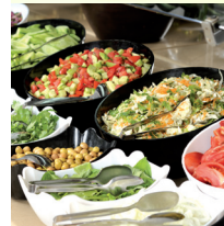
Tant et plus